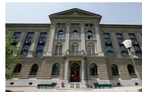
Bundesarchiv an der Archivstrasse in Bern.